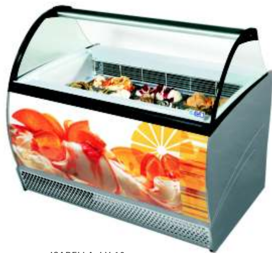
ISABELLA LX 10